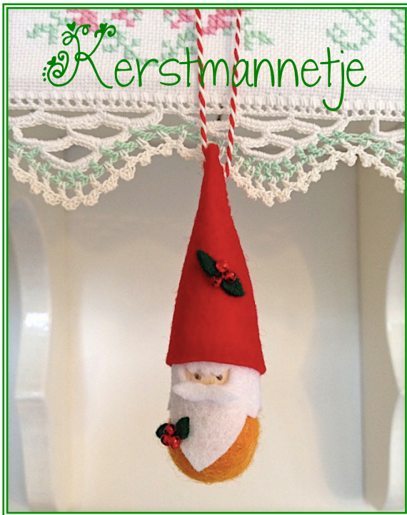
Een zelfmaak-pakketje van Atelier het Blauwe Huis, speciaal ontworpen voor www.disolut.com